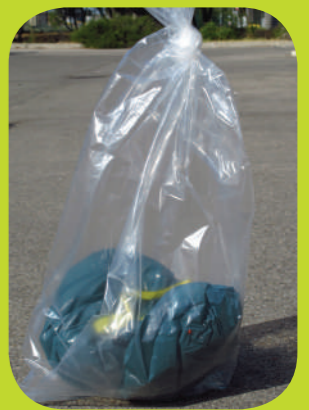
Iznīcina visus bojātos augļus