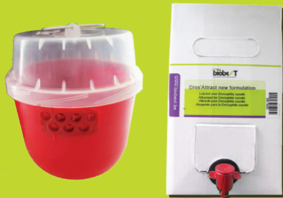
ATKLĀŠANA Droso slazdi un Dros'Attract