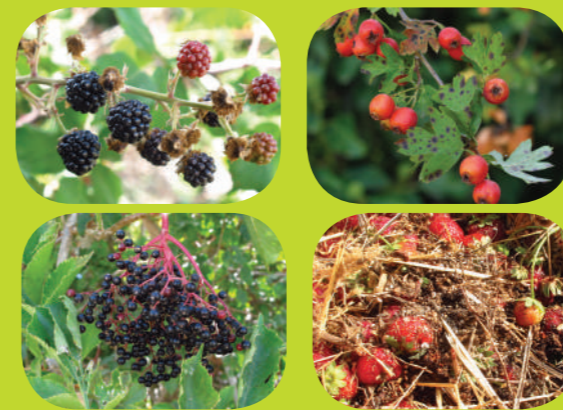
Iznīcina potenciālos cēloņus (nezālas, augu atliekas)