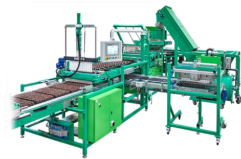
Pilnībā automātiskās mašīnas