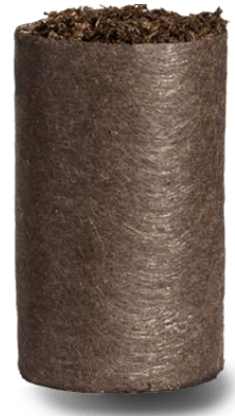
Bioloģiski sadalās 12+ mēnešu laikā