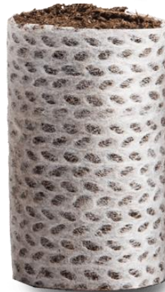
Bioloģiski sadalās 8-12 mēnešu laikā