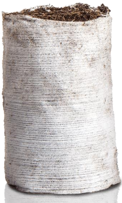
Bioloģiski sadalās 2 mēnešu laikā