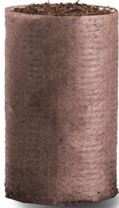
Bioloģiski sadalās 3-5 mēnešu laikā