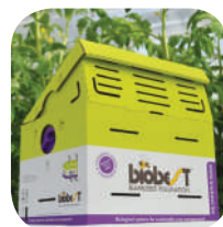
Aizveriet stropa vāku