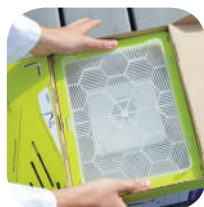
Uzmanīgi piespiediet plastmasas konteineri