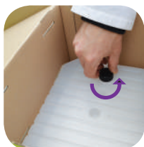
Atskrūvējiet Biogluc korķi