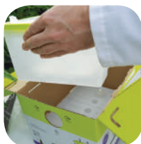
Novietojiet atpakaļ plastmasas konteineri ar kameņiem