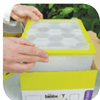
Izņemiet plastmasas konteineri

BRĪDINĀJUMS: izvairieties mainīt dakts stāvokli atverot Biogluc® trauku. Tas vēlāk var radīt traucējumus cukursīrupa padēvē.