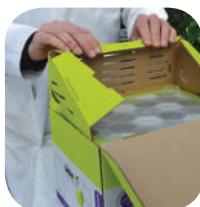
Nolociet augšmalas, kā parādīts