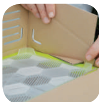
Nolociet sānu panelu apakšmalas, kā parādīts