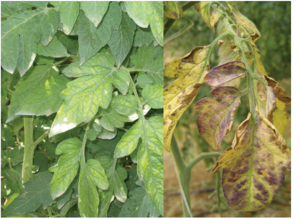
TICV-TOCV Tomātu infekciозs hlorozes vīruss Виррус инфекционного хлороза томата - Виррус хлороза томата Tomato infectious chlorosis virus - Tomato chlorosis virus