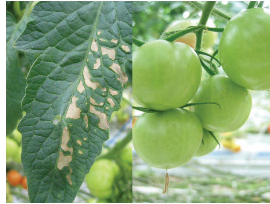
Clavibacter Tomātu bakterioze, bakteriālais vēzis Бактериальный рак Bacterial canker