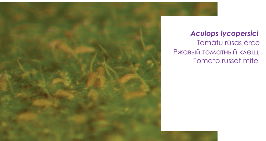
Aculops lycopersici Tomātu pūšas ērcē Ржавый томатный клещ Tomato russet mite