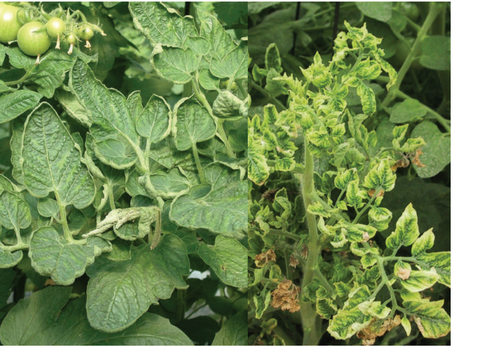
TYLCV Tomātu dzelteno lapu čokurošanās vīruss Виррус желтой курчавости листьев томата Tomato yellow leaf curl virus