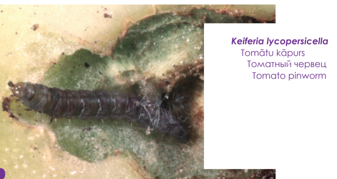
Keiferia lycopersicella Tomātu kāpuris Томатный червец Tomato pinworm