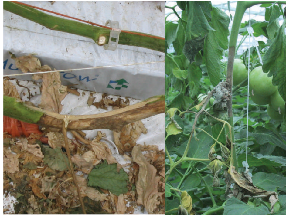
Botrytis Pelēkā puve Серая гниль Gray mould