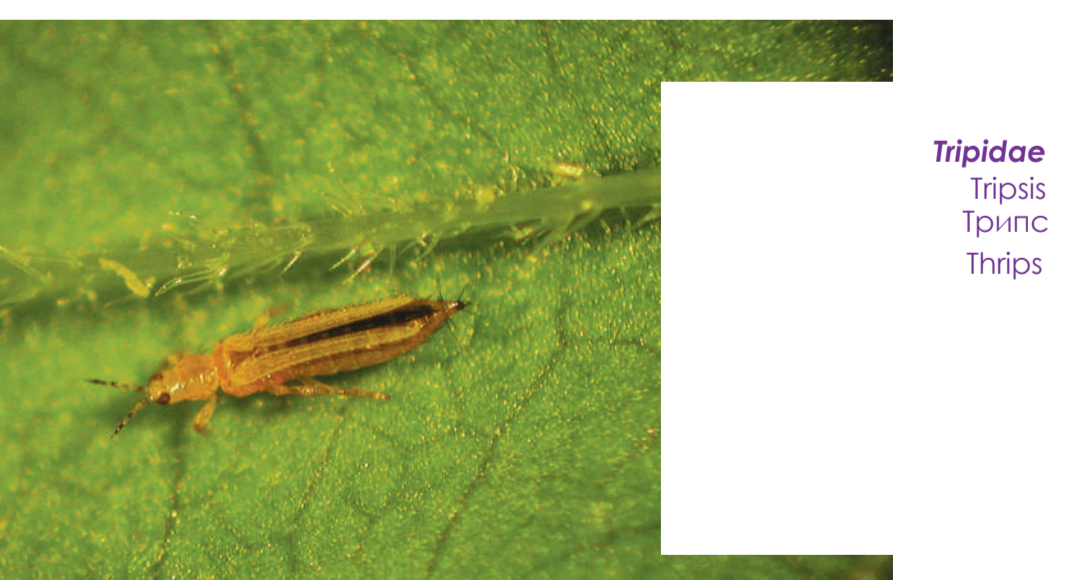
Tripidae Трипс Трипс Thrips