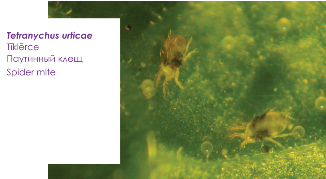
Tetranychus urticae Pūkļēse Паутинный клещ Spider mite