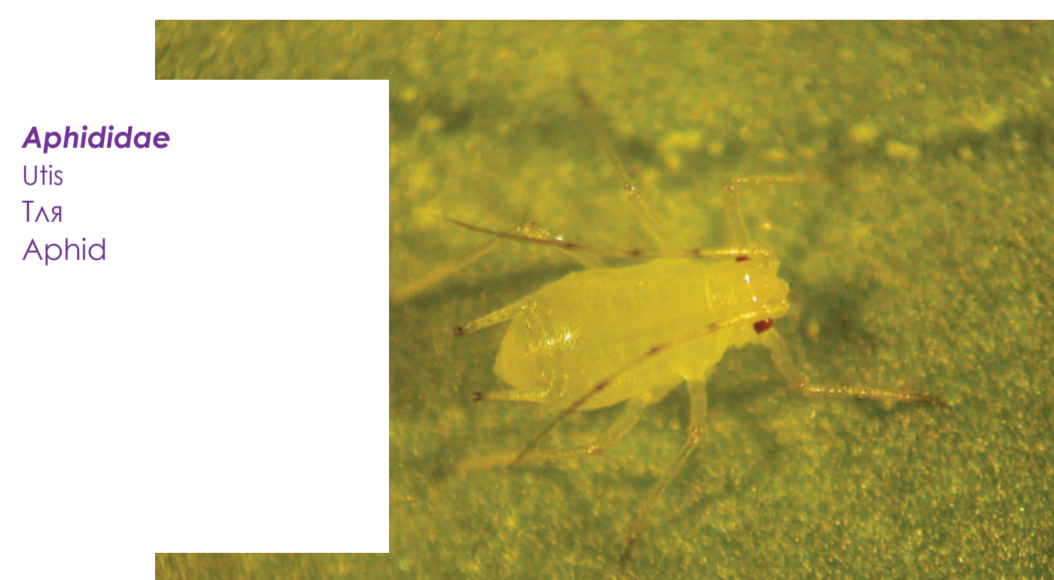
Aphididae Uģis Тля Aphid