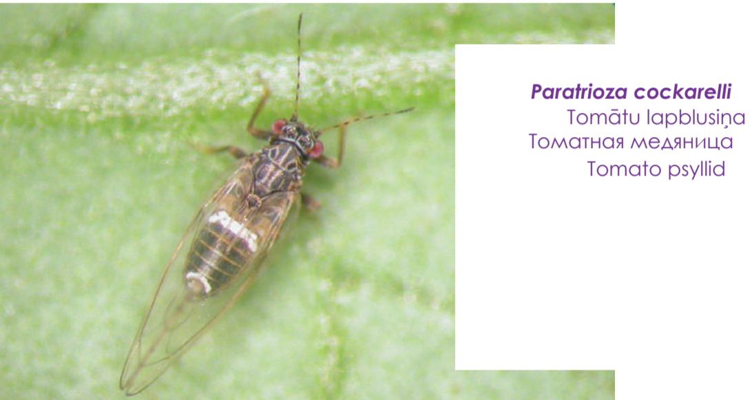
Paratizioa cockarelli Tomātu laprabulstņa Томатной мядвницца Tomato psyllid