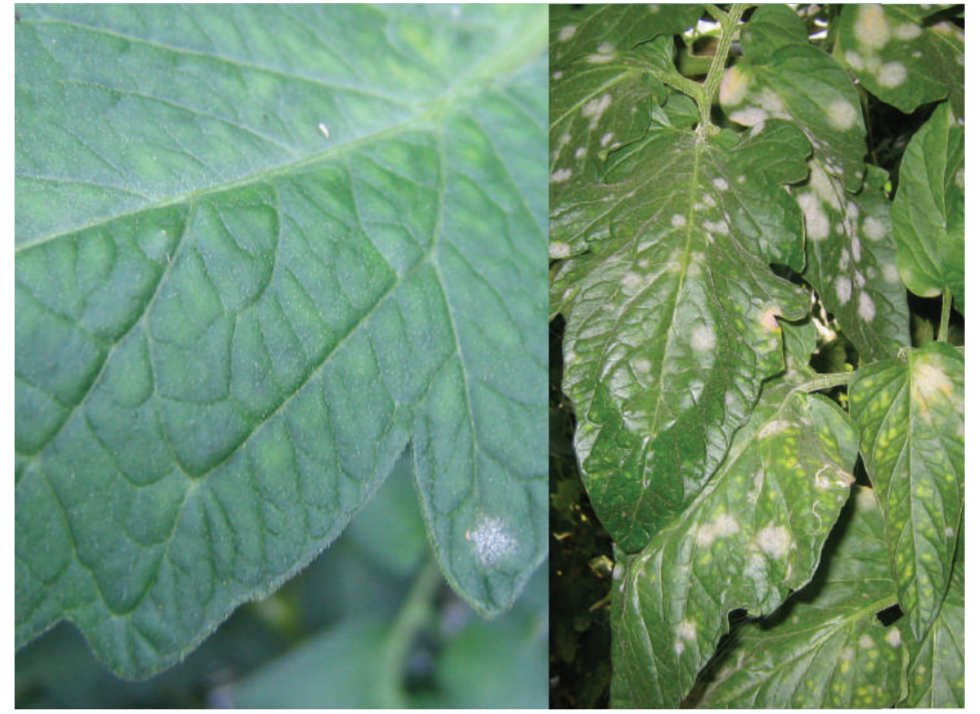
Oidium Miltiņsā Носотоящая мучнистая роса Powdery mildew