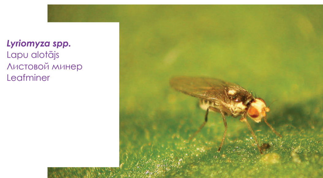
Liriomyza spp. Lapu abāļis Листоной минер Leafminer