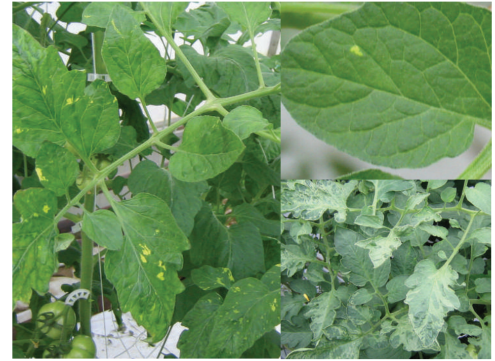
PepMV Pepino mozaikas vīruss Виррус мозаики перуано Pepino mosaic virus