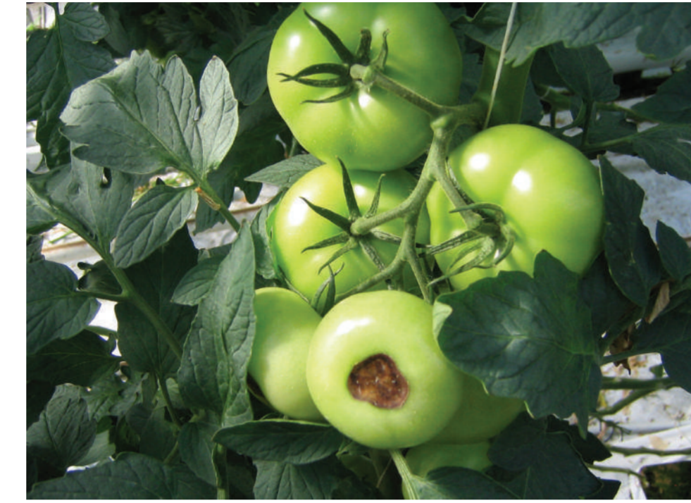
Galatija puve Вершинная гниль Blossom end rot