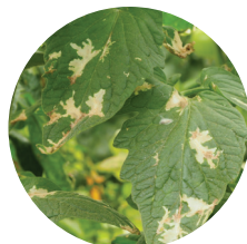
Izgrauztas ejas lapās