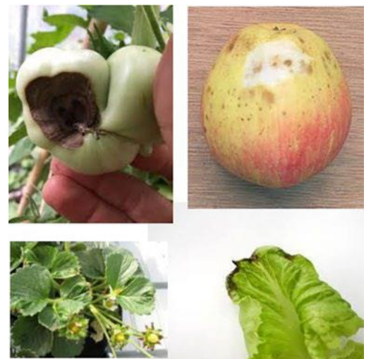
Kalcija deficīts dažādās kultūrās